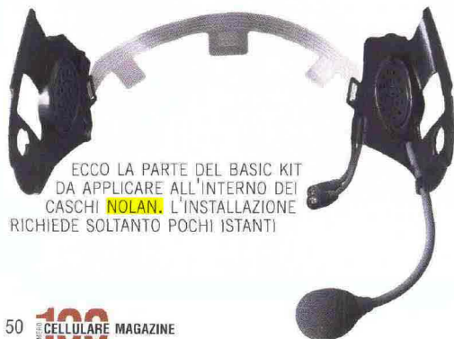
ECCO LA PARTE DEL BASIC KIT DA APPLICARE ALL'INTERNO DEI CASCHI NOLAN. L'INSTALLAZIONE RICHIEDE SOLTANTO POCCHI Istanti

L'N-Com Basic Kit è disponibile a partire da 55 euro (il prezzo varia in base al tipo di casco cui si riferisce) mentre l'Intercom Kit costa 112 euro.